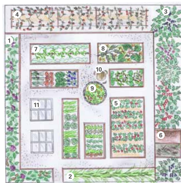
1 Poteter 2 Asparges 3 Diverse bærbusker 4 Bringebærhekk 5 Jordbær 6 Kompost 7 Grønnsaker i blanding 8 Rabarbra og fennikel 9 Blomster til mat og vase 10 Sitteplass 11 Drivbenk

Kassen hvor du det 1. året dyrker de krevende, skal brukes til de middels krevende året etter. 3. året brukes kassen til de lite krevende, og 4. året fylles kassen med grønningsplanter. Slik er syklusen sluttet.